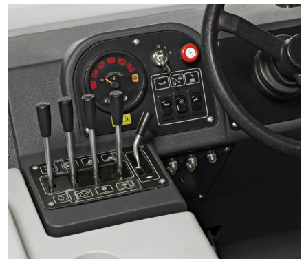
Comandi facili da utilizzare, per una reale semplicità di utilizzo