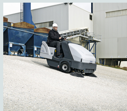
La spazzatrice Nilfisk SR 1601 supera pendenze fino al 25% (versione a gasolio Motore Kubota 3 cilindri)