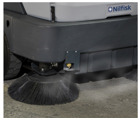
L'esclusivo sistema di controllo delle polveri ad acqua nebulizzata (di serie sulla versione MAXI) abbatte le polveri sollevate durante l'attività di pulizia. Il sistema funziona grazie a degli ugelli posizionati sulla spazzola/e laterale/i. Il serbatoio acqua ha una capacità di 45 litri