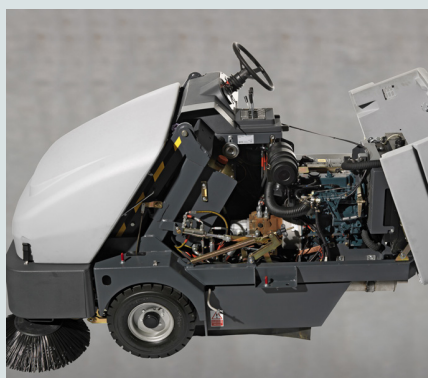
Tutti i componenti principali sono facilmente accessibili. La manutenzione risulta rapida e semplice