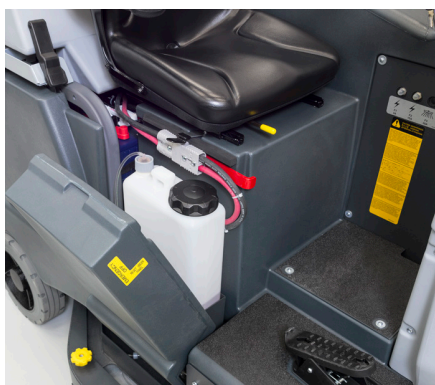
Il sistema Ecoflex™ si caratterizza per il facile accesso alla tanica del detergente