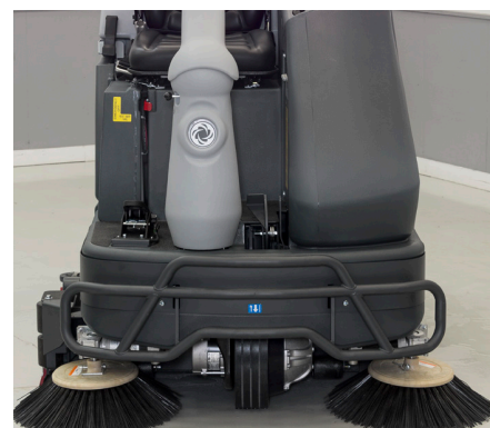
Spazzole laterali retrattili (di serie sul modello cilindrico) per convogliare i detriti al centro della macchina