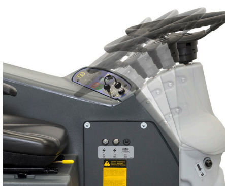
Volante e sedile regolabili per consentire un facile accesso e una maggiore ergonomia