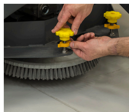
Manopole di regolazione colorate di giallo per semplificare la manutenzione giornaliera