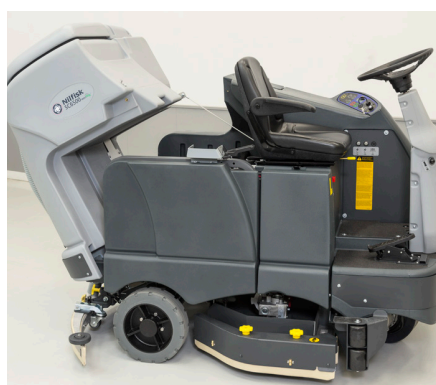
Il serbatoio di recupero può essere inclinato per una pulizia più agevole e per accedere facilmente al vano batterie